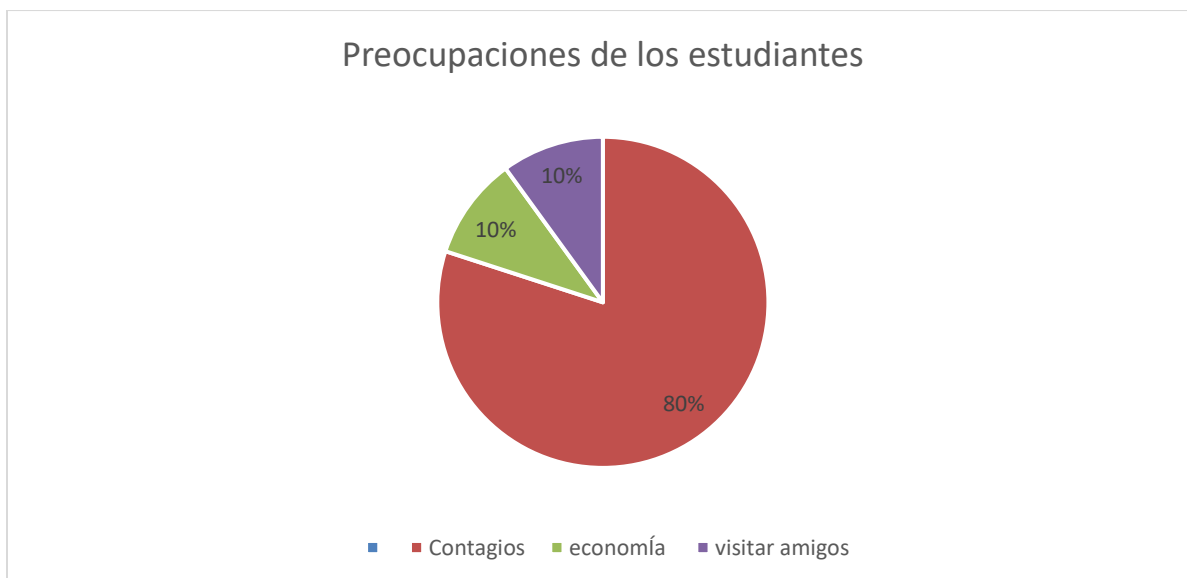
Grafica 1. Principales factores estresores o preocupaciones en los estudiantes.

Desde la aparición del coronavirus y el confinamiento a los estudiantes encuestados les preocupaba en mayor proporción (80%) el que él o alguien de su familia pudiera contagiarse, en un 10% les agobian las dificultades económicas que se presentaron en sus familias y en similar proporción 10% el no poder visitar a amigos (ver gráfica 1).